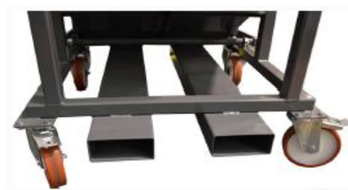
Système de vidange: Enfourchable par un chariot élévateur